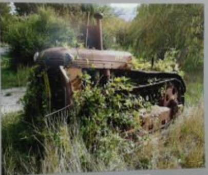
C'est la retraite ! On se met au vert !