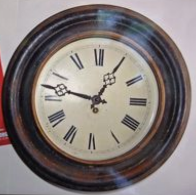
Tract ... heure