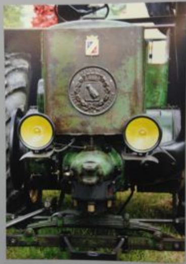
« T'as d'abord vu, tu sais ! »